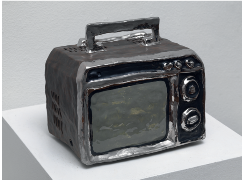
Universum SK 992, 2017 Glasierte Keramik, 26 x 26 x 22 cm