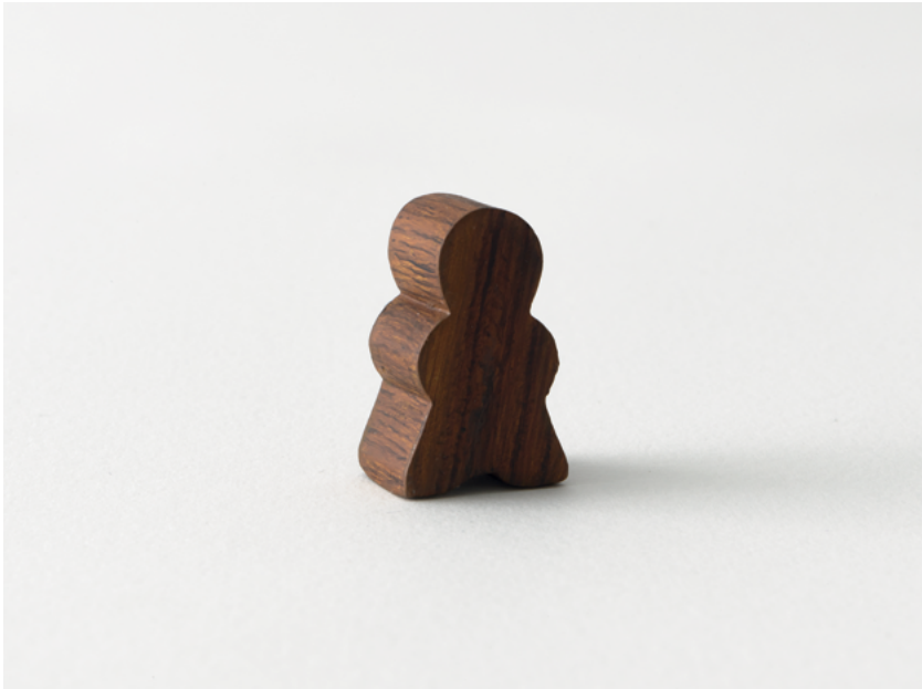
Peterle, 2019 Bronze, Acryl, 3,3 x 2 cm