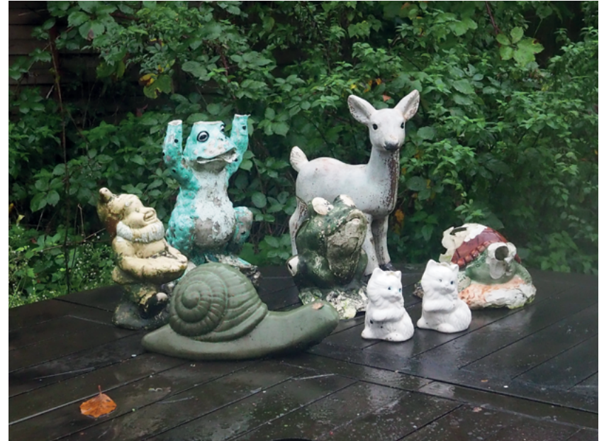
Am Kemperbach und Wiesenstraße, 2019 Keramik, Keramikfarbe, Witterungsrückstände Figurenkonstellation auf ca. 30 x 30 x 30 cm