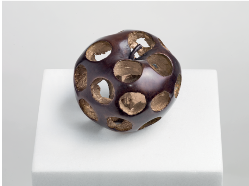
Malus Fularum, 2019 Bronze, 6 x 7,5 x 7,5 cm, 11/12 + 3 AP