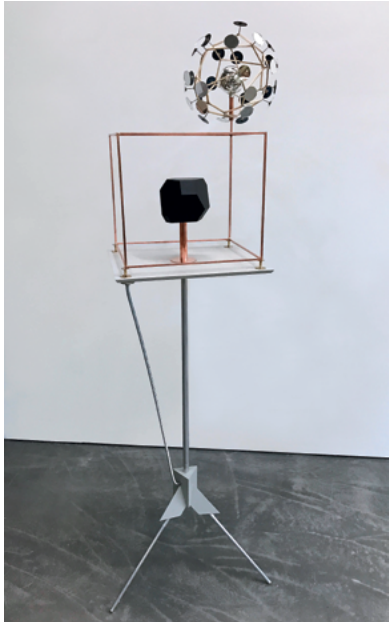
Vakuum mit Reflektor (Nasa Melancholia), 2017 Holz, Kupfer, Messing, Aluminium, Spiegel, Christbaumkugel, Lack 160 x 45 x 40 cm