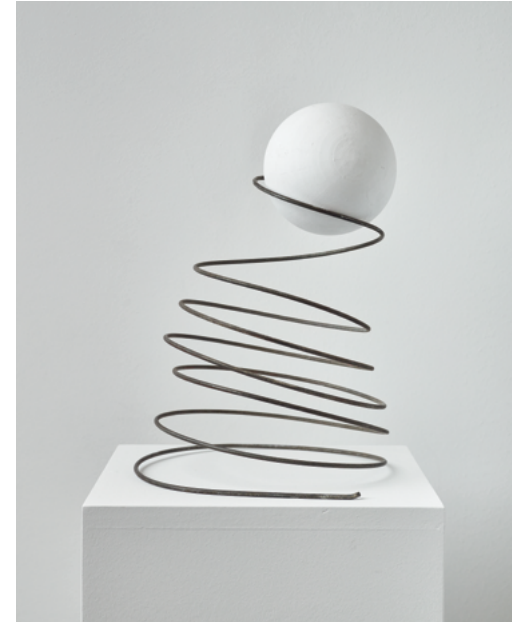
Sprungfeder, 2015 Gips, Metall, 35 x 23 x 24,5 cm, Edition 5 von 5