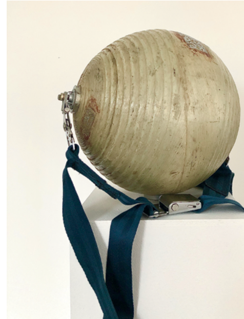
Sphere Ride, 2019 Aluminium, Fiberglas, Anschlaggurt Maße variabel (inklusive Sockel), 170 x 37 x 37 cm