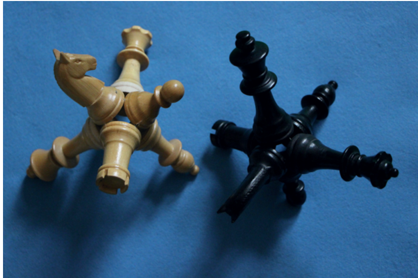
Gamble (Chess Dice), 2019 Holz, Nägel, Filz, 2 Teile, je 13 x 13 x 13 cm, Ed. 1/3 (+1 AP)