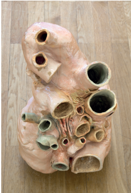
Walherz (Squish), 2018 Glasierte Keramik, 60 x 37 x 28 cm