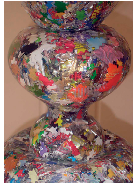
Mit welchen Ohren höre ich im Traum, 2011 Plastik-Verpackung, Polyester-Gießharz, Federstahl, Keramik 98 x 16 x 16 cm