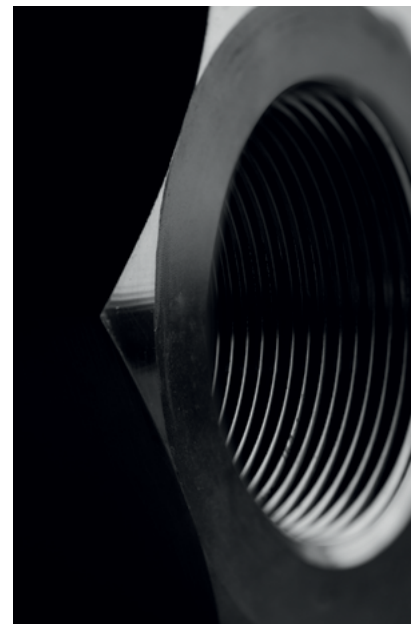
M80, 2019 Metall, 13 x 20 x 6 cm Photo (Detail) Hiu Tung Ching Courtesy KWADRAT